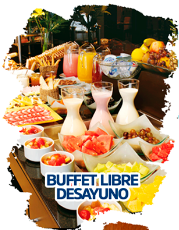
BUFFET LIBRE DESAYUNO

Viaje subvencionado para jubilados de una duración de 6 días en hotel 4 estrellas con pensión completa. Disfruta todos los días de tratamientos con circuito de spa, piscina climatizada, chorros a presión, camas flotantes, sauna finlandesa, baño turco, sala de relajación y de masajes. Realizaremos excursiones a algunos de los pueblos más bonitos de España y bodegas de vino. Tendremos todos los días bingo, bailes y animación.