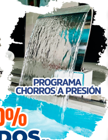
PROGRAMA CHORROS A PRESIÓN